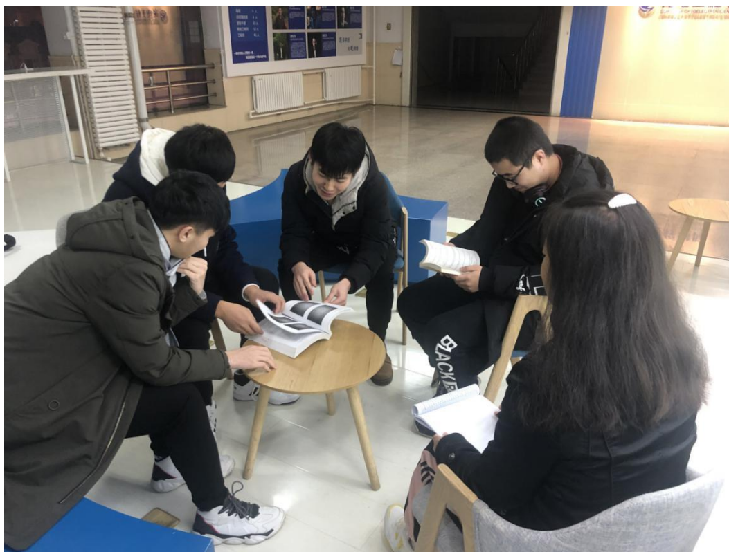
实验室成员进行学术讨论