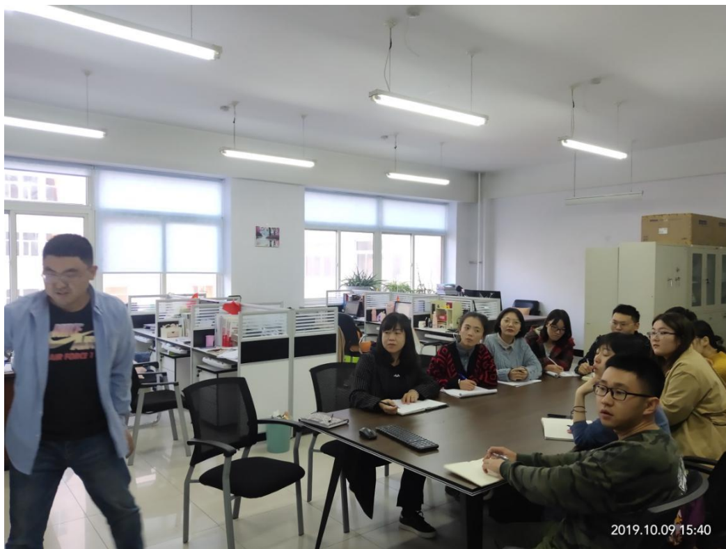
老师与学生开小组报告会