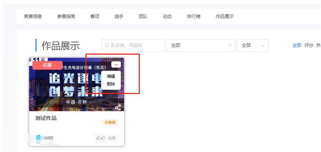
图 16 编辑/删除作品

注意：1、上传的 PDF 文档请检查是否能在线展示；若出现数学公式无法显示，请把公式作为图片插入；上传的视频检查是否能在线播放浏览，视频格式是 mp4 格式。若无法播放，请用转码器转成编码为 H264 的视频重新上传。