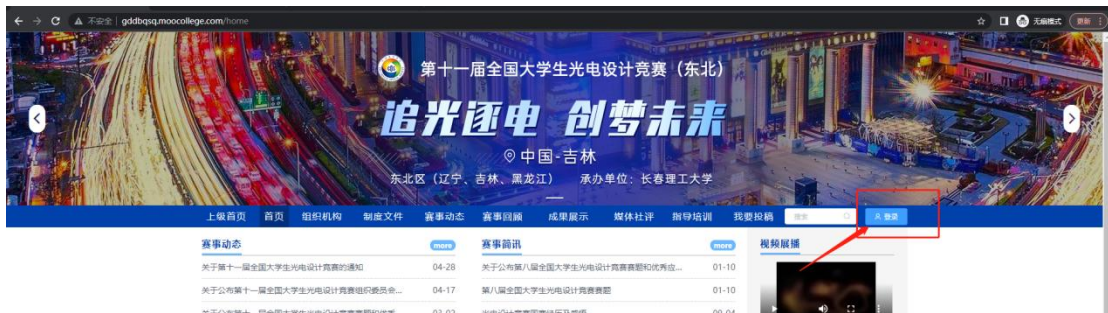
图 2 东北区官网

1. 打开官网地址： http://gddebqsq.mooccollege.com/home ，点击登录。如图 2