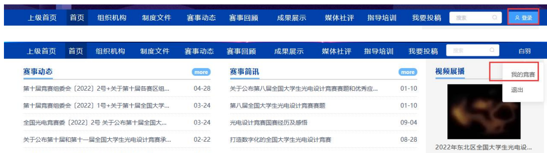
图 10 我的竞赛

注意：此时队员不需要重新注册账号，如图 10 所示点击登录，登录后点击我的竞赛-个人信息-点修改下拉框，只需要完善个人信息中带*的必填项即可(如图 11 所示)，完善个人信息后即可退出系统。