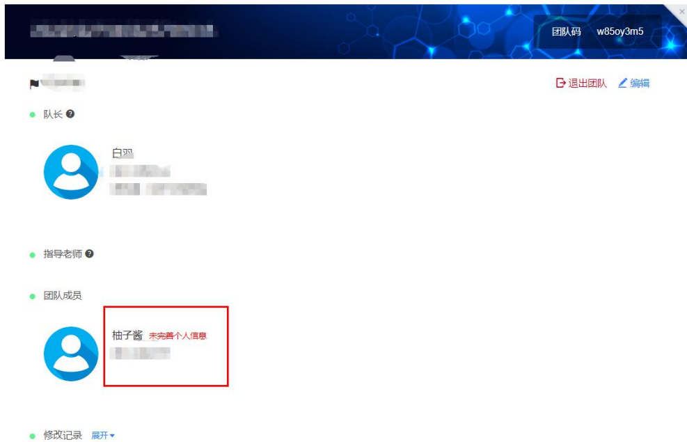
图 9 队伍编辑页面