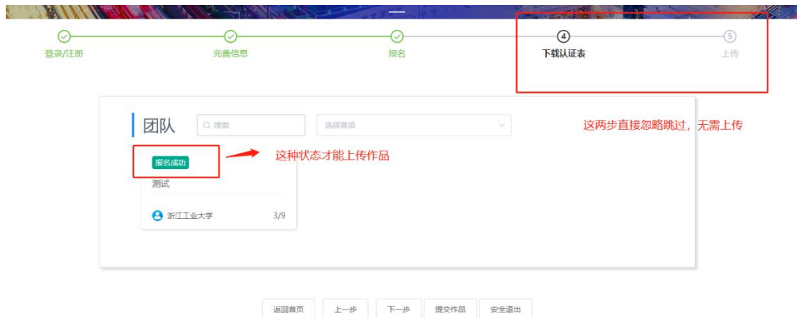
图 12 团队状态页面