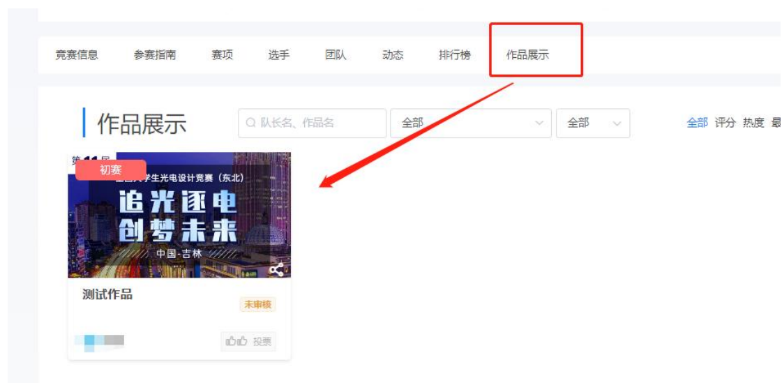
图 15 作品上传成功

3.在提交作品截止时间内，参赛队长有权限在作品展示，点击作品进行编辑或删除作品，如